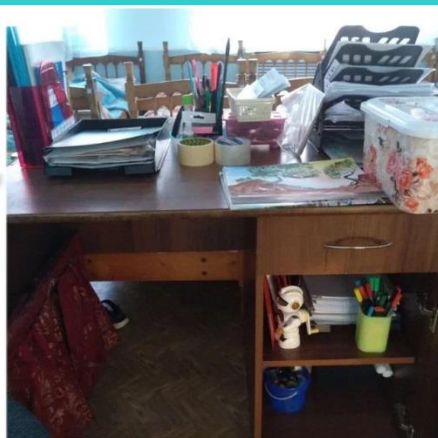
Акция "Чистый стол" Группа 3Б