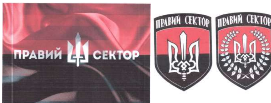
Рисунок 11. Атрибутика организации «Правый сектор».