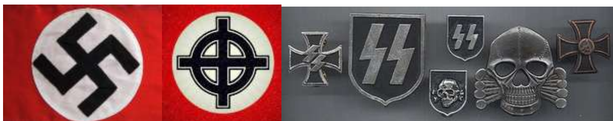
Рисунок 10. Нацистская атрибутика и символика.

Атрибутики, символики запрещенных в Российской Федерации экстремистских и террористических организаций: