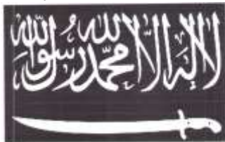
Рисунок 13. Символика организации «Кавказский эмират» («Имарат Кавказ»).

Рисунок 12. Символика организации «Исламское государство».