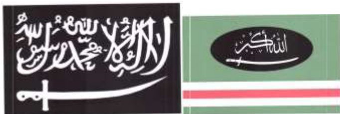
Рисунок 14. Символика вилайетов (административно-территориальных образований) организации «Кавказский эмират» («Имарат Кавказ»).

Рисунок 13. Символика организации «Кавказский эмират» («Имарат Кавказ»).